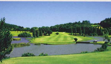
稲取ゴルフクラブ 賀茂郡東伊豆町稲取3337 0557-95-2311