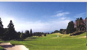
大熱海国際ゴルフクラブ 伊豆の国市長者原1240 0558-79-0011