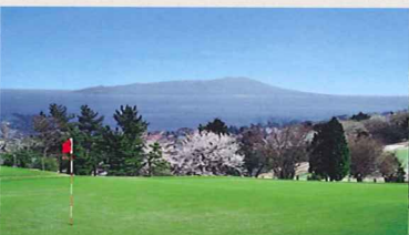
ゴールド川奈カントリークラブ 伊東市吉田834 0557-45-1151