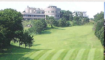
フジ天城ゴルフ倶楽部 伊豆市大平柿木1190-1 0558-87-0523