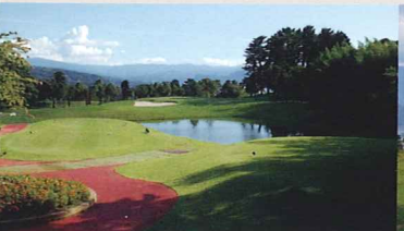
かなみスプリングスカントリークラブ 田方郡函南町桑原1300-146 055-974-1000