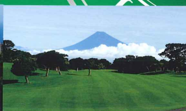
天城高原ゴルフコース 伊豆市管引638-83 0557-29-1133