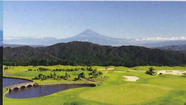
伊豆ハイツゴルフ倶楽部 伊豆市地藏堂845-67 0558-83-3500