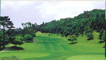
伊東カントリークラブ 伊東市荻694-1 0557-36-5865