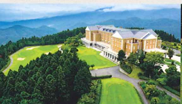
湯ヶ島ゴルフ倶楽部&ホテル董苑 伊豆市湯ヶ島2571-10 0558-85-2100