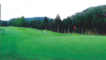
伊豆スカイラインカントリー倶楽部 伊豆市上白岩2067-25 0558-83-2222