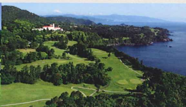
川奈ホテルゴルフコース 伊東市川奈1459 0557-45-1111