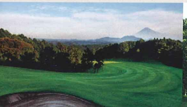
修善寺カントリークラブ 伊豆市日向965 0558-72-2227