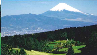
伊豆ならやまカントリークラブ 伊豆の国市中1613 055-944-2222