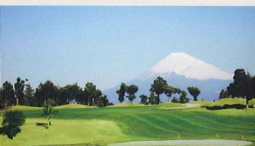
中伊豆グリーンクラブ 伊豆市冷川1521-108 0558-83-3200