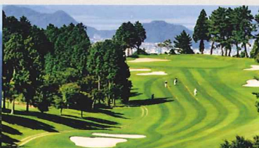
函南ゴルフ倶楽部 田方郡函南町桑原高雄山1315-25 055-978-3220