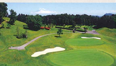
ラフォーレ修善寺&カントリークラブ 伊豆市大平1529 0558-72-3311