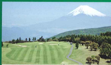
芦の湖カントリークラブ 三島市南原管4708 055-985-2146