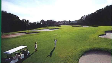
伊豆下田カントリークラブ 賀茂郡南伊豆町入間2383-1 0558-62-2211