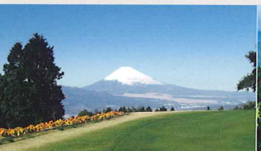
富士箱根カントリークラブ 伊豆の国市奈古谷2225 055-944-2111