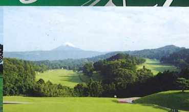
伊豆大仁カントリークラブ 伊豆の国市浮橋1198 0558-79-0221