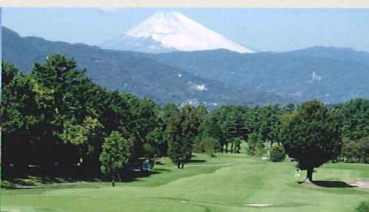
サザンクロスカントリークラブ 伊東市吉田1006 0557-45-1234