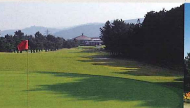
西熱海ゴルフコース 熱海市西熱海1800 0557-84-1111